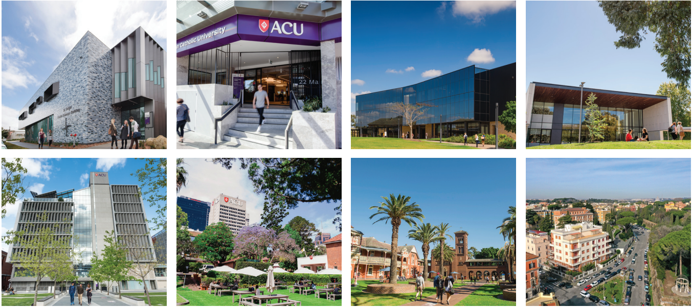
(由左至右) 巴拉瑞特校区、悉尼布莱克敦校区、布里斯班校区、堪培拉校区、墨尔本校区、北悉尼校区、悉尼史卓菲校区、意大利罗马校区。