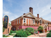
NORTH-SYDNEY (北悉尼) 校区