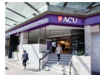
BLACKTOWN (布莱克敦) 校区