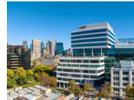
MELBOURNE (墨尔本) 校区