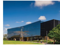
BRISBANE (布里斯班) 校区