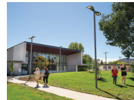
CANBERRA (堪培拉) 校区