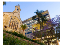
BRISBANE (布里斯班) 领导力中心