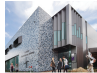
BALLARAT (巴拉瑞特) 校区