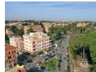
ROME (意大利罗马) 校区