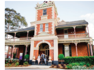
STRATHFIELD (史卓菲) 校区