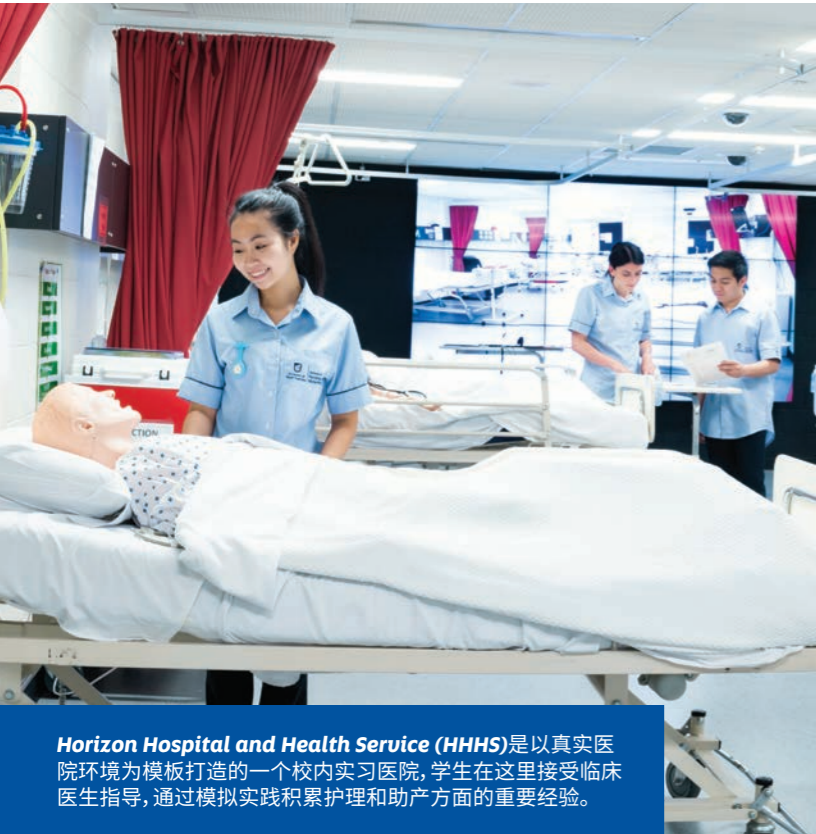
Horizon Hospital and Health Service (HHHS)是以真实医院环境为模板打造的一个校内实习医院, 学生在这里接受临床医生指导, 通过模拟实践积累护理和助产方面的重要经验。