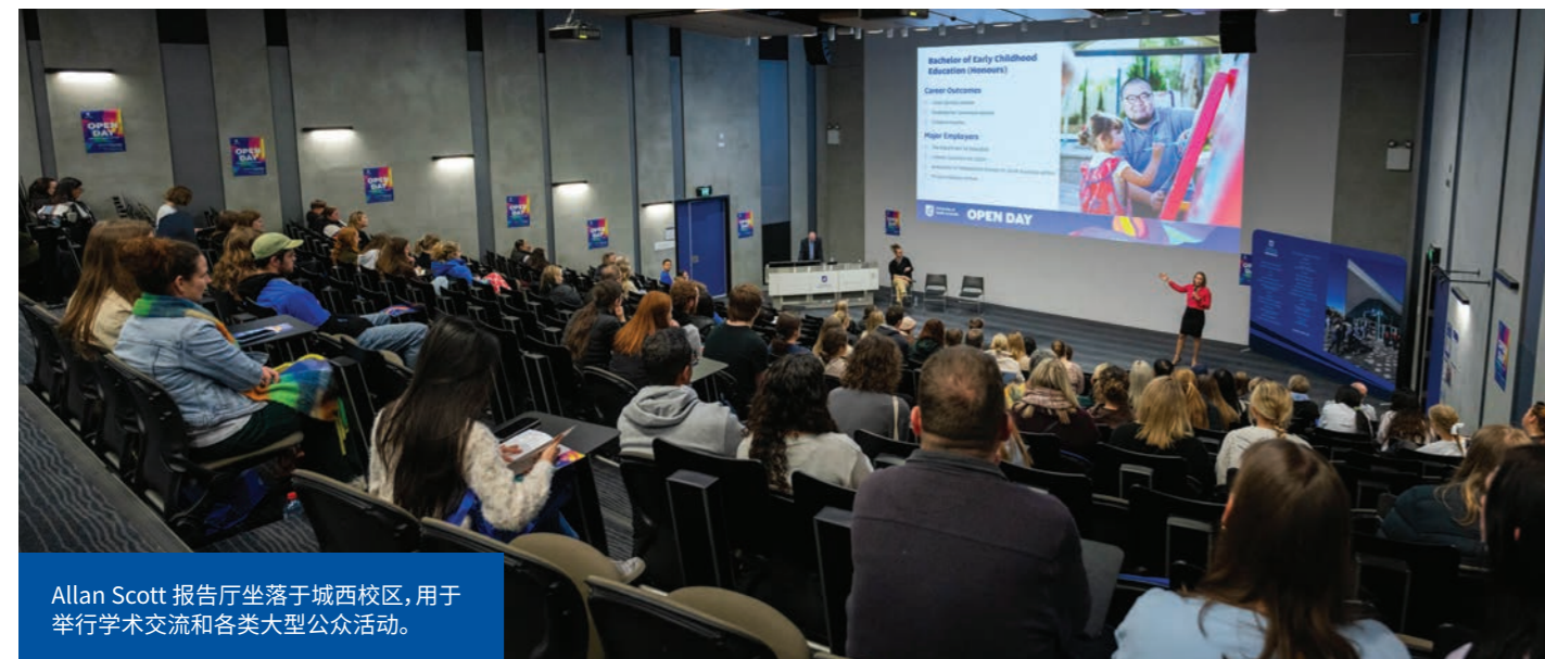
Allan Scott 报告厅坐落于城西校区, 用于举行学术交流和各类大型公众活动。