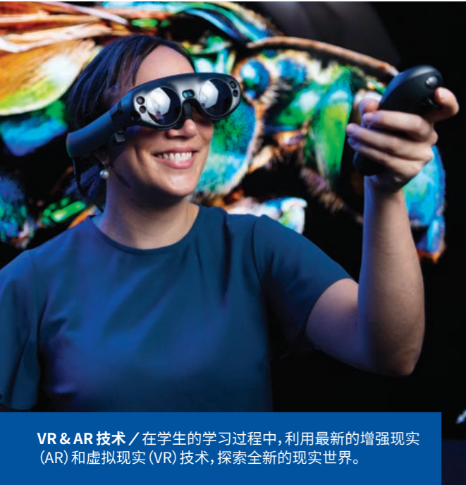
VR & AR 技术 / 在学生的学习过程中, 利用最新的增强现实 (AR) 和虚拟现实 (VR) 技术, 探索全新的现实世界。

校园内有全新的建筑、现代化的设施以及充满活力的社交空间——南澳大学的莘莘学子适逢来此求学的最佳时机。从以下方面可见一斑。