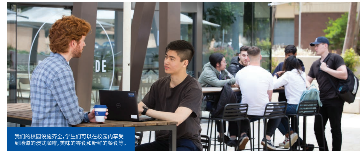
我们的校园设施齐全, 学生们可以在校园内享受到地道的澳式咖啡, 美味的零食和新鲜的餐食等。