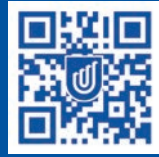
南澳大学中文网站

Australian University provider number PRV12107