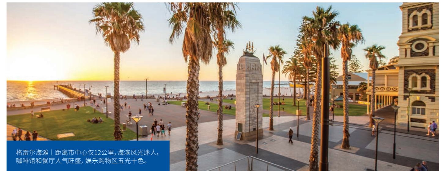
格雷尔海滩 | 距离市中心仅12公里, 海滨风光迷人, 咖啡馆和餐厅人气旺盛, 娱乐购物区五光十色。