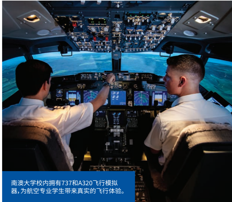
南澳大学校内拥有737和A320飞行模拟器, 为航空专业学生带来真实的飞行体验。