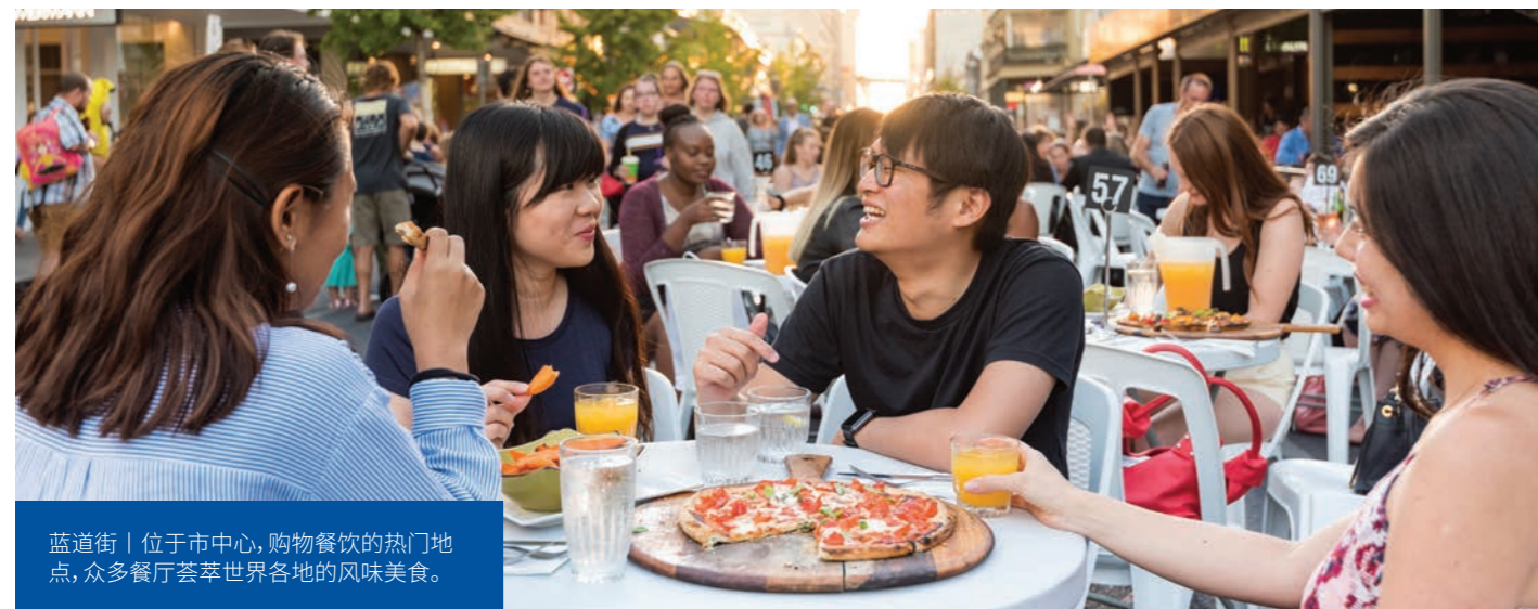
蓝道街 | 位于市中心, 购物餐饮的热门地点, 众多餐厅荟萃世界各地的风味美食。